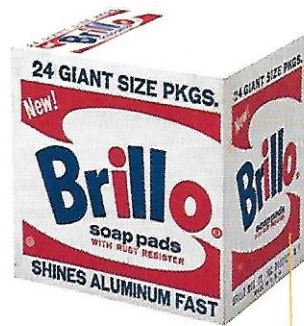
Andy WARHOL, Boîte de savon Brillo , 1964, sérigraphie et acrylique sur contreplaqué, 43,2 x 43,2 x 36,5 cm. The Museum of Modern Art, New York.

■ Lettre de Richard HAMILTON aux Smithson, 16 janvier 1957.